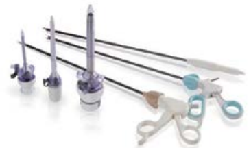
Disposable Laparoscopic Instruments