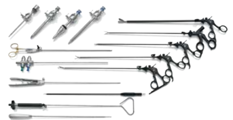
Reusable Laparoscopic Instruments