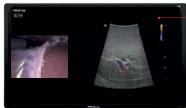
32/55 inch 4K 3D Monitor

Digital Operating Room Upgraded Management